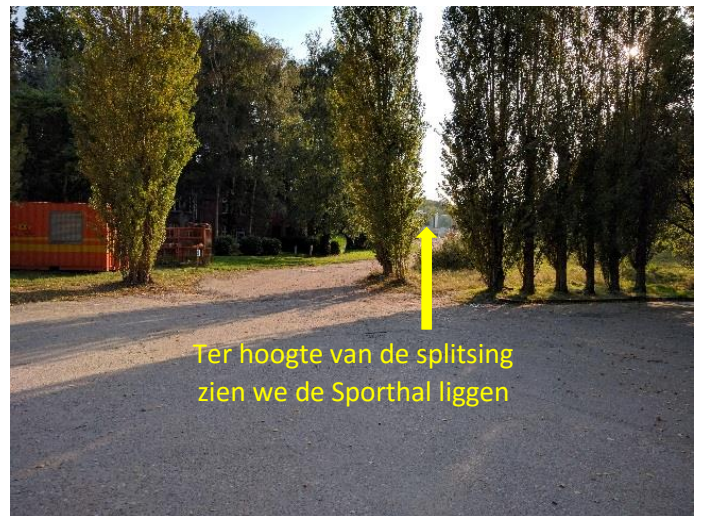
Ter hoogte van de splitsing zien we de Sporthal liggen