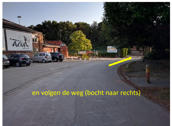
en volgen de weg (bocht naar rechts)