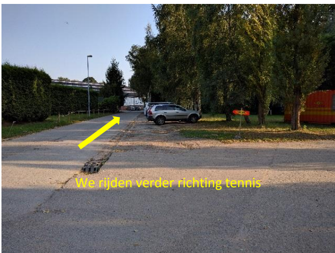
We rijden verder richting tennis