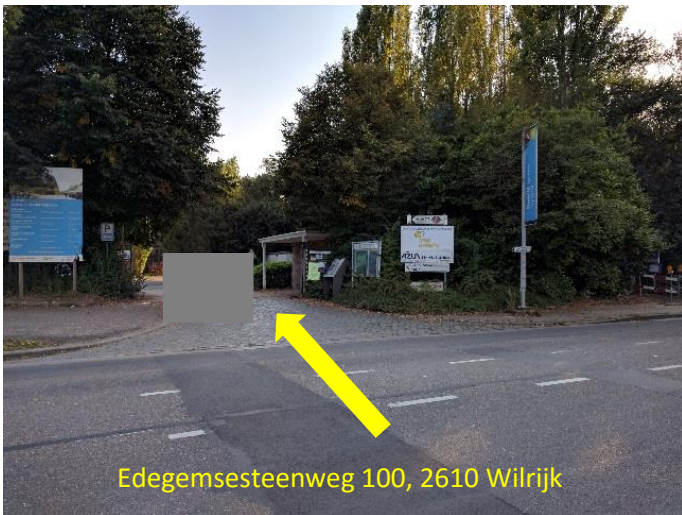
Edegemsesteenweg 100, 2610 Wilrijk